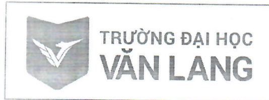
Hình 3.1. Logo trường Đại học Văn Lang (từ nguồn tài liệu (Bảo, 2022))