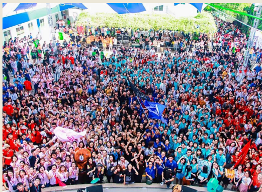
CƠ SỞ 2 233A Phan Văn Trị, P. 11, Q. Bình Thạnh, Tp. Hồ Chí Minh