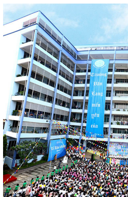
CƠ SỞ 2 233A Phan Văn Trị, P. 11, Q. Bình Thạnh, Tp. Hồ Chí Minh