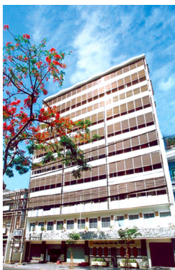
CƠ SỞ 1 45 Nguyễn Khắc Nhu, P. Cô Giang, Q. 1, Tp. Hồ Chí Minh