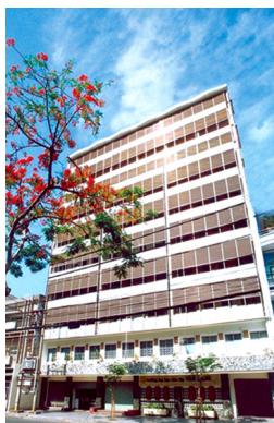
CƠ SỞ 1 45 Nguyễn Khắc Nhu, P. Cô Giang, Q. 1, Tp. Hồ Chí Minh