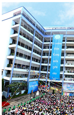
CƠ SỞ 2 233A Phan Văn Trị, P. 11, Q. Bình Thạnh, Tp. Hồ Chí Minh