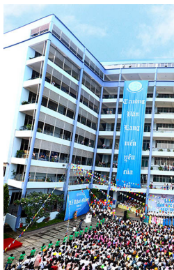
CƠ SỞ 2 233A Phan Văn Trị, P. 11, Q. Bình Thạnh, Tp. Hồ Chí Minh