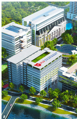
CƠ SỞ CHÍNH 69/68 Đặng Thùy Trâm, P.13, Q.Bình Thạnh, Tp. Hồ Chí Minh