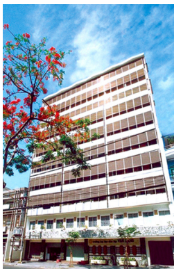
CƠ SỞ 1 45 Nguyễn Khắc Nhu, P. Cô Giang, Q. 1, Tp. Hồ Chí Minh